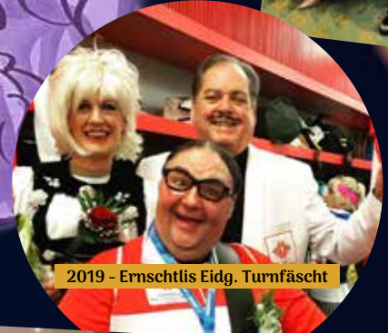
2019 - Ernschtis Eidg. Turnfäscht