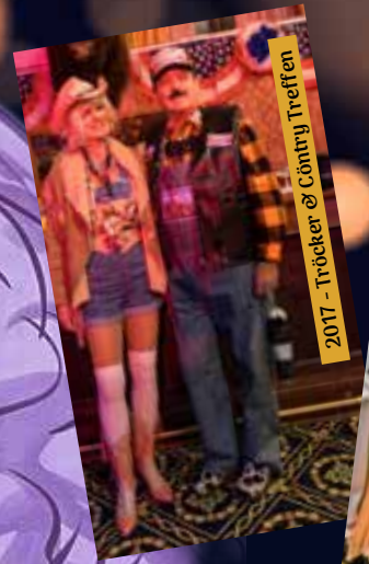
2017 - Tröcker & Cömy Treffen