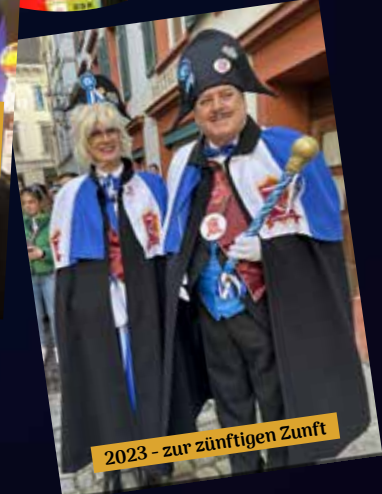
2023 - zur zünftigen Zunft