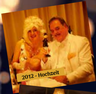
2012 - Hochzeit