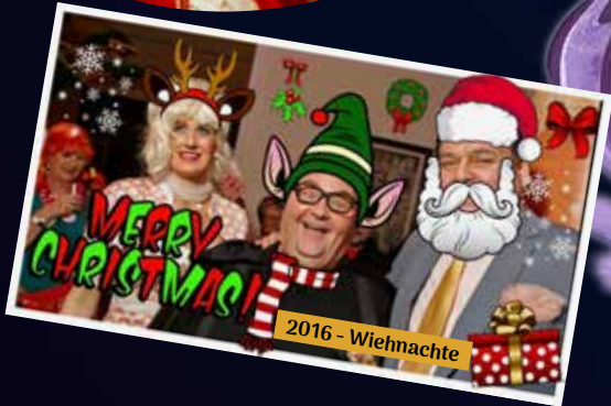
2016 - Wiehnachte