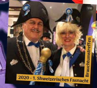
2020 - 1. Schweizerisches Fasnacht