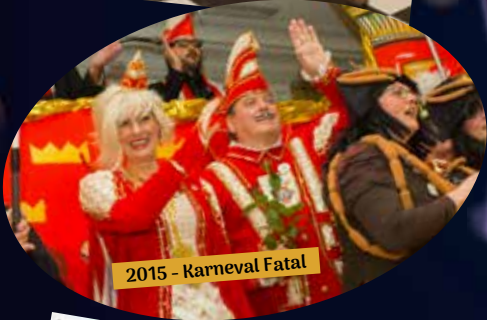
2015 - Karneval Fatal